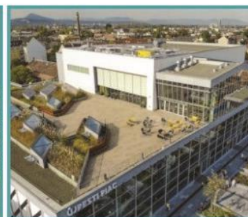
1 UP Újpesti Rendezvénnytér 1042 Budapest IV. Szent István tér 13-14.