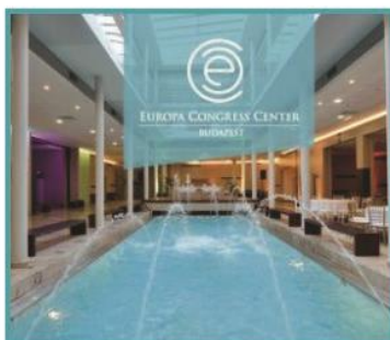
1 Europa Congress Center Budapest 1021 Budapest II. Hárshegyi út 5-7.